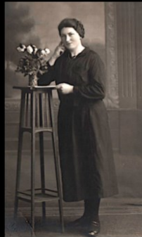
19 et 60 ans