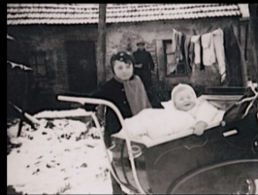
Derrière la maison natale