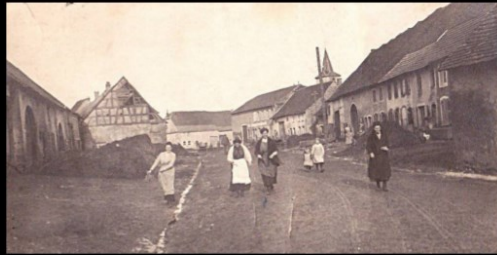
Loudrefing terre de nos ancêtres