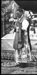
Curé et capitaine